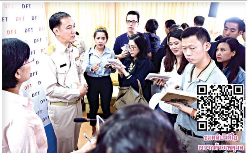
ชมคลิปวิดีโอเจรจาด้วยเหตุผล

“พาณิชย์” เสียอภัยไม่ตอบโต้ทางการค้าสหรัฐ ตัดจีเอสพีสินค้าไทย 573 รายการ เตรียม 7 มาตรการรับมือผลกระทบ แลยูเอสที่อาร์กัตตันให้ไทยแก้กฎหมายแรงงาน 7 ข้อ แต่ทำตามได้ 5 ข้อ เย้ยที่เหลื่ออเมริกาเอง ยังทำไม่ได้ให้สิทธิ ◆ อ่านต่อหน้า 8